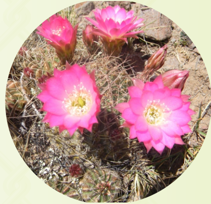
LA FLOR DE SANK'AYU