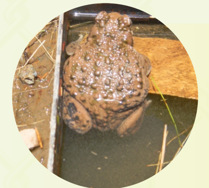
COLOR DE LA PIEL DEL SAPO (HAMP'ATU)