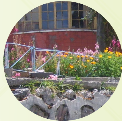
LAS FLORES DEL JARDIN.