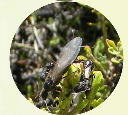
2 DE FEBRERO.